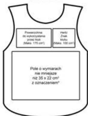
STANDARDOWE ZAGOSPODAROWANIE POWIERZCHNI -przód znacznika

*Największy kolorowy znak w jednym wierszu (PS, TV, RP, TV, TV, FOTO) o wysokości nie większej niż 12 cm - font „Tahoma Bold”. pod nie - napisem pionowym font informacyjny numer porządkowy (001,002,003, 004) o wysokości 10 cm - font „Tahoma Bold”. Największy znak w dwóch wierszach (MEDIAS KLUB) o wysokości nie większej niż 8 cm - font „Tahoma Bold”.