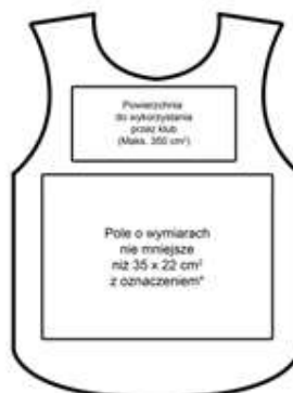
STANDARDOWE ZAGOSPODAROWANIE POWIERZCHNI -tył znacznika

*Największy znak w jednym wierszu (PS, TV, RP, TV, TV, FOTO) o wysokości nie większej niż 12 cm - font „Tahoma Bold”. pod nie - napisem pionowym font informacyjny numer porządkowy (001,002,003, 004) o wysokości 10 cm - font „Tahoma Bold”. Największy znak w dwóch wierszach (MEDIAS KLUB) o wysokości nie większej niż 8 cm - font „Tahoma Bold”.